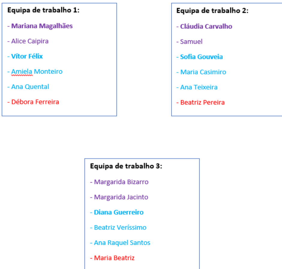
Figura 2. Distribuição do NEAPTEC pelas respetivas equipas de trabalho

O objetivo desta divisão em equipas de trabalho é de possibilitar planear e trabalhar em diversos projetos ao mesmo tempo, aumentando assim a quantidade de conteúdo produzido pelo NEAPTEC.